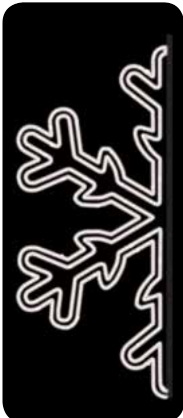
Trazado de medio copo de nieve. Figura con doble trazado.